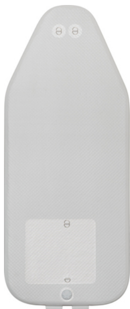
Technologia budowy podłogi z airmaty