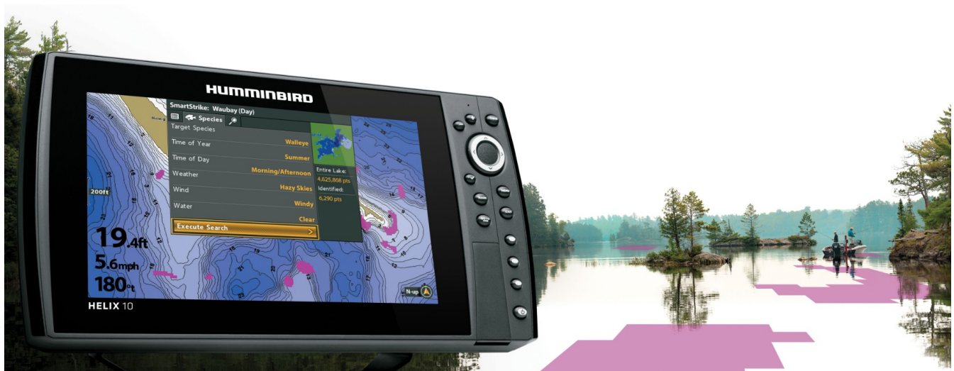
Echosonda Humminbird HELIX 10 CHIRP MEGA SI + GPS G4N

Jeśli wędkowanie to nasze DNA nie istnieje pojęcie „za wcześnie” czy „za daleko”. Nasze wyśrubowane oczekiwania zaspokoi jedynie urządzenie z najwyższej półki. Proste, funkcyjne, niezawodne. Taki właśnie jest nowy Helix .